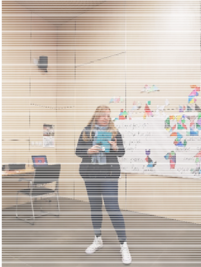
IES La Llitera

Durante el descanso del café, aprovechamos para intercambiar los materiales de la actividad “Sant Jordi de poble a poble”, diseñada por las profesoras del CEIP María Moliner y el IES Valderrobres durante su estancia en las Islas Baleares con motivo del Simposi anteriormente mencionado.