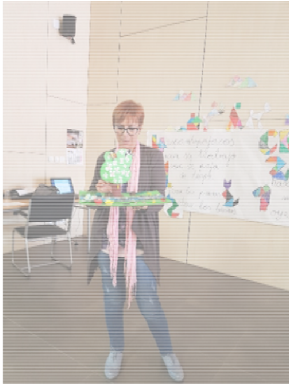
CRA Ribagorza Oriental