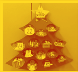
CRA La Llitera (Tamarit de Llitera)