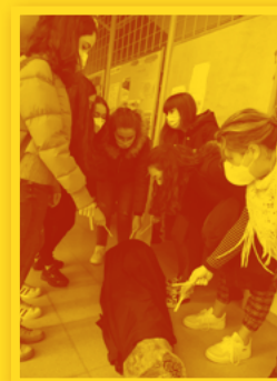
IES Matarraña (Vall-de-roures)

Els centres es van decorar amb Arbres de Nadal plens de bons desitjos per l'Any Nou: