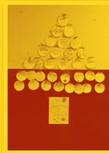
CEIP Virgen del Portal (Maella)

Tampoc van faltar les targetes de felicitació nadalenca en diferents formats: