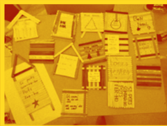
IES Matarraña (Vall-de-roures)