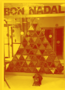
CEIP San José de Calasanz (Fraga)