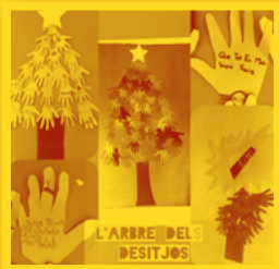
CRA Olea (Bordón, la Ginebrosa i Aiguaviva)

Els centres es van decorar amb Arbres de Nadal plens de bons desitjos per l'Any Nou: