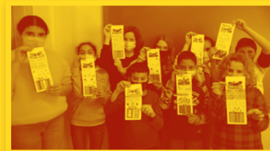
CRA Matarranya (Calaceit, la Vall del Tormo i Massalió)