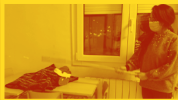
EOI Ignacio Luzán (Monzón)