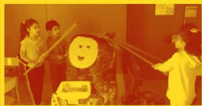
CEIP María Moliner (Fraga)

Aquí tenim alguns exemples de com van fer cagar el Tronc de Nadal: