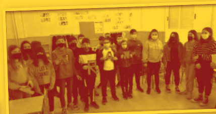
TARRANCUT i TRAPASSER IES Baix Matarranya (Maella)