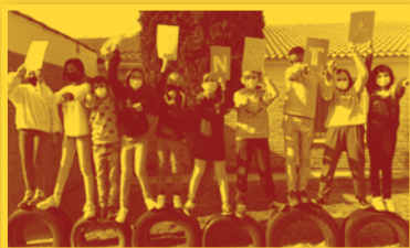
BRUNETA . CRA Olea