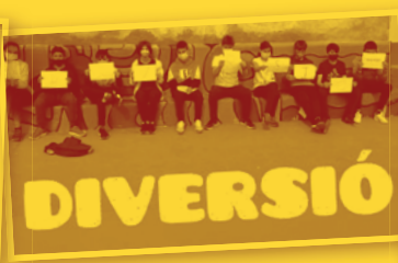
DIVERSIÓ . CPI de Benavarri