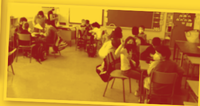
FILLO CEIP Virgen del Portal (Maella)