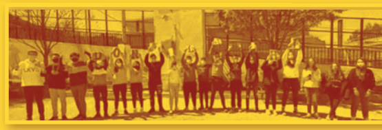
DONA-LA-HI . IES Matarraña (Vall-de-roures)