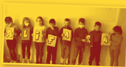
ALIFARA . CRA Alifara, la Portellada