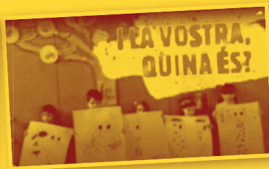
SALUT . CEIP Maria Moliner (Fraga)