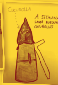
PANISTRE i CUCUROLLA CRA Matarranya (Calaceit, la Vall del Tormo i Massalió)