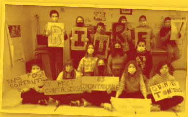
RIURE CEIP Vicente Ferrer Ramos, Vall-de-roures

El curs passat 10 centres educatius van realitzar el primer projecte europeu eTwinning dedicat a la llengua catalana d'Aragó. Va ser un projecte transversal des d'Infantil a Secundària en el qual cada centre va gravar un vídeo sobre una paraula que els identifiqués, bé perquè fos del lèxic propi de la zona, bé perquè estigués en perill d'extinció o els representés com a territori o pel seu projecte de centre.