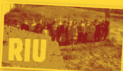
RIU . CRA Tastavins