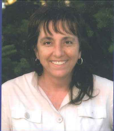
Fotografía de Pedro Montaner